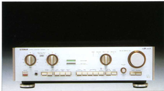
インテグレートドアンプ

●実効出力 / 63W + 63W (8Ω 1kHz 両ch) ●歪率 / 0.02%以下 ●入力感度 / phono (MM): 1.8mV, (MC): 250μV, tuner, aux / DAD, monitor; 160mV ●入力インピーダンス / phono (MM): 50kΩ, (MC): 100Ω, tuner, aux / DAD, monitor; 40kΩ ●SN比 (IHF-A) / phono (MM): 90dB, (MC): 67dB, tuner, aux / DAD, monitor; 105dB ●寸法・重量 / 453(W) × 111(H) × 321(D)mm - 7.6kg