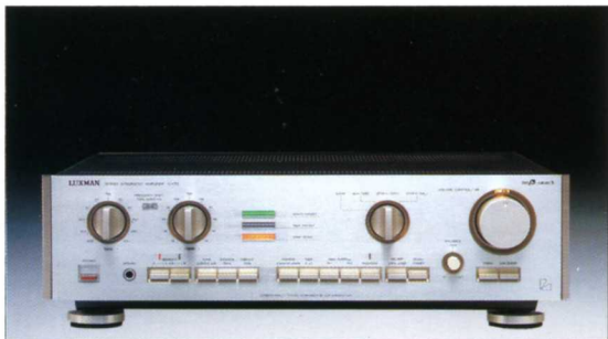
インテグレートドアンプ