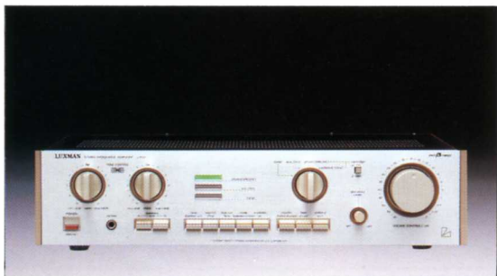
インテグレートドアンプ

●実効出力 / 105W + 105W (8Ω 1kHz 両ch) ●歪率 / 0.009%以下 ●入力感度 / phono (MM): 2.5mV, (MC): 100μV, tuner, aux / DAD, monitor, main-in; 200mV ●入力インピーダンス / phono (MM): 50kΩ, (MC): High-Low切替, tuner, aux / DAD, monitor; 40kΩ, main-in; 50kΩ ●SN比 (IHF-A) / phono (MM): 90dB, (MC): 67dB, tuner, aux / DAD, monitor, main-in; 110dB ●寸法・重量 / 453(W) × 135(H) × 425(D)mm - 13.5kg