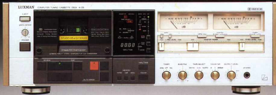
※別売 リモート・コントロール・ユニット AK-10 ¥7,000 別売 ワイヤレス・リモート・コントロール・ユニット AK-20 ¥18,000